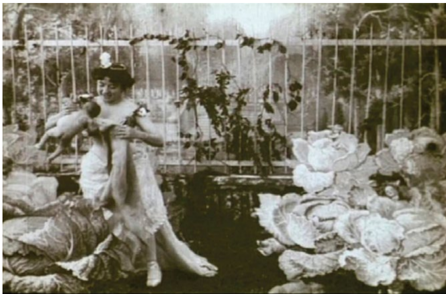
• LA FÉE AUX CHOUX