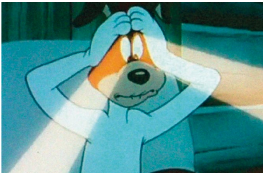
• LE COUP DU LAPIN