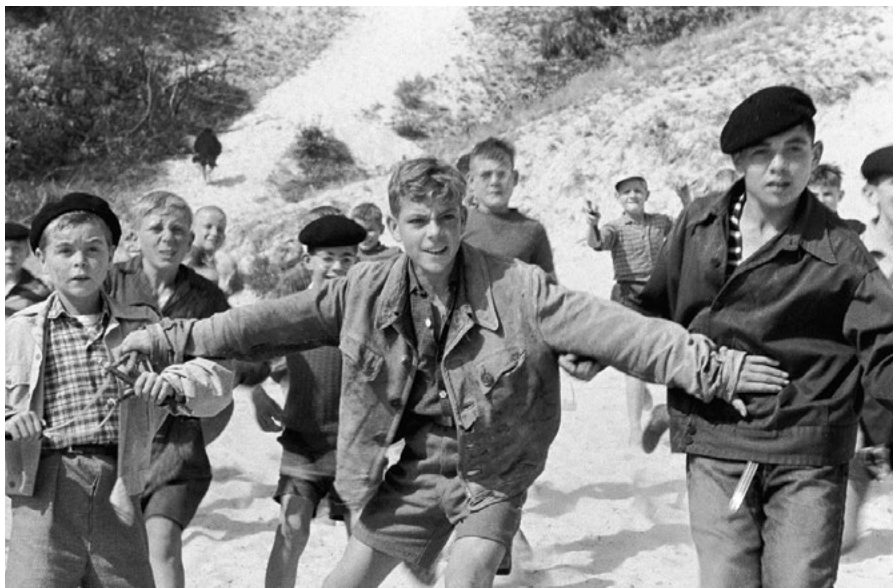
• LA GUERRE DES BOUTONS