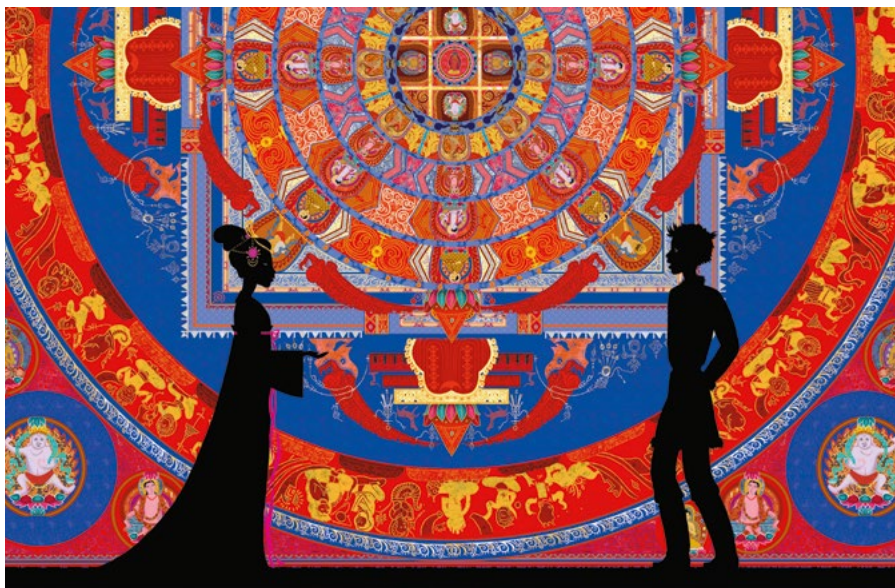
• LES CONTES DE LA NUIT