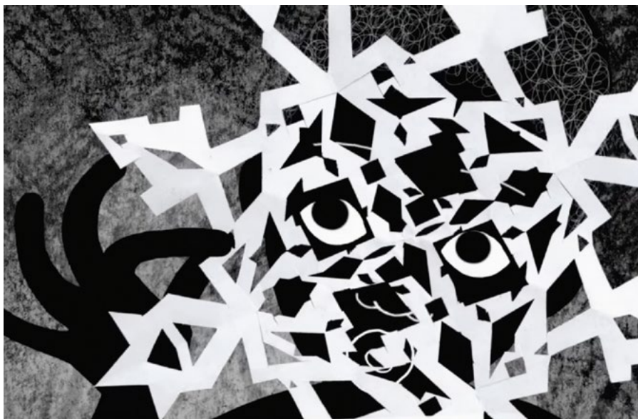
• FLOCON DE NEIGE