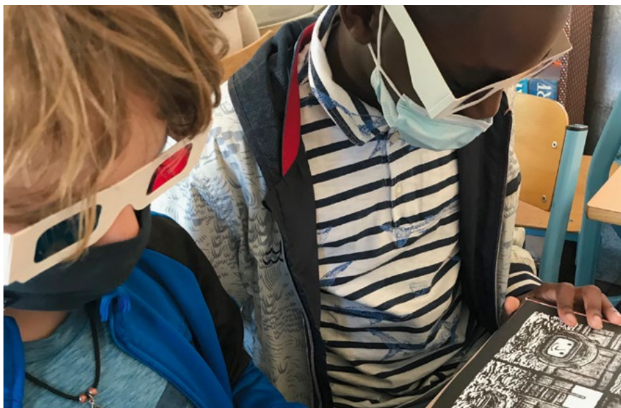
• ATELIER «JE N'EN CROIS PAS MES YEUX»