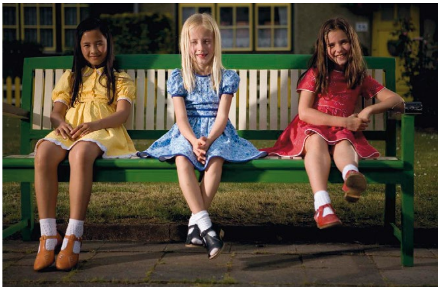
• MR. NOBODY