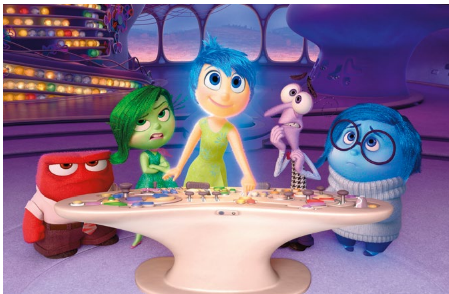
• VICE VERSA