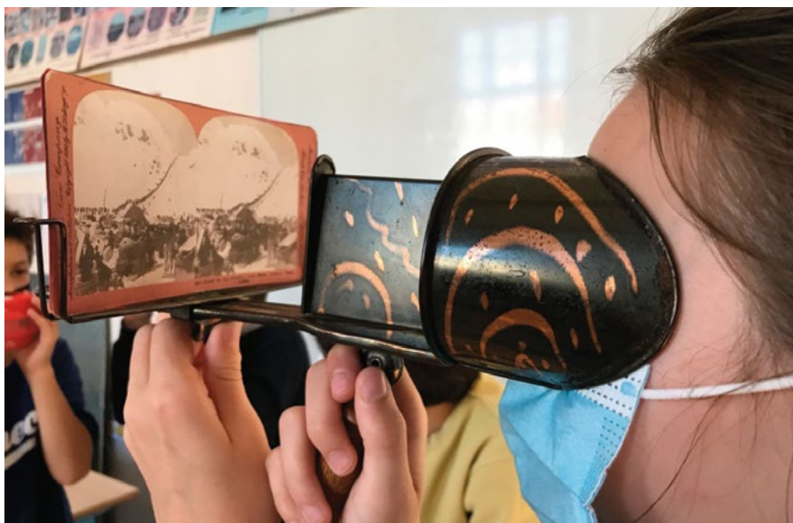
• UTILISATION D'UN STÉRÉOSCOPE DE HOLMES