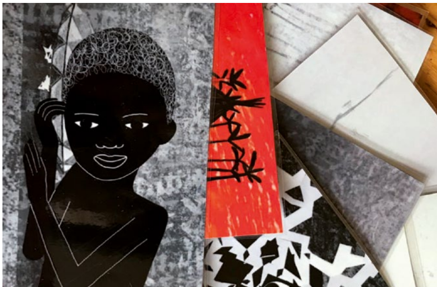
• FLOCON DE NEIGE