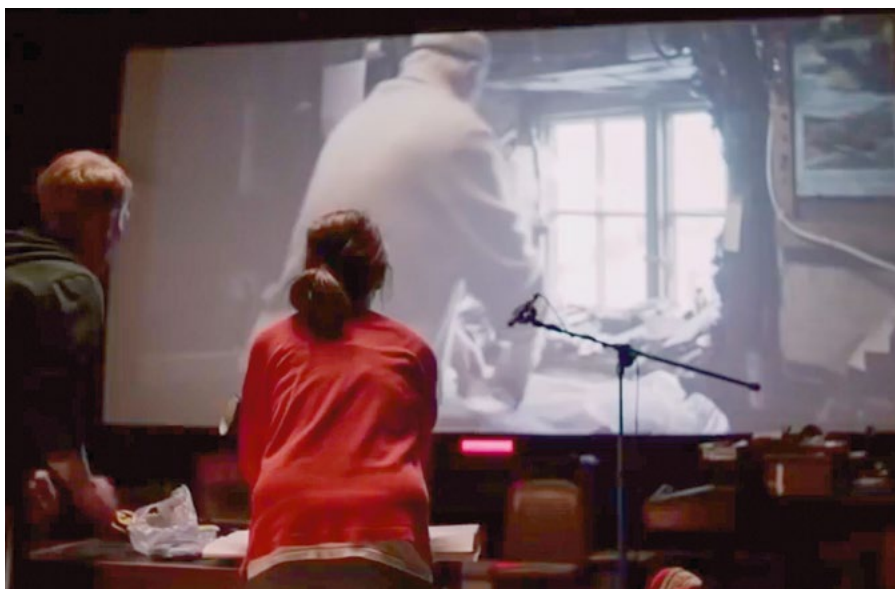
• ATELIER CINÉMA SONORE