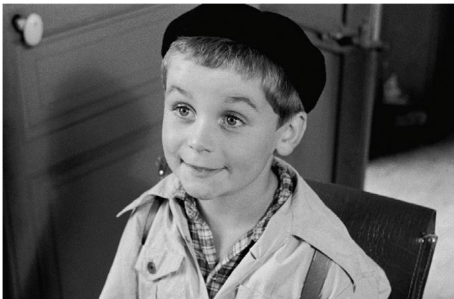
• LA GUERRE DES BOUTONS