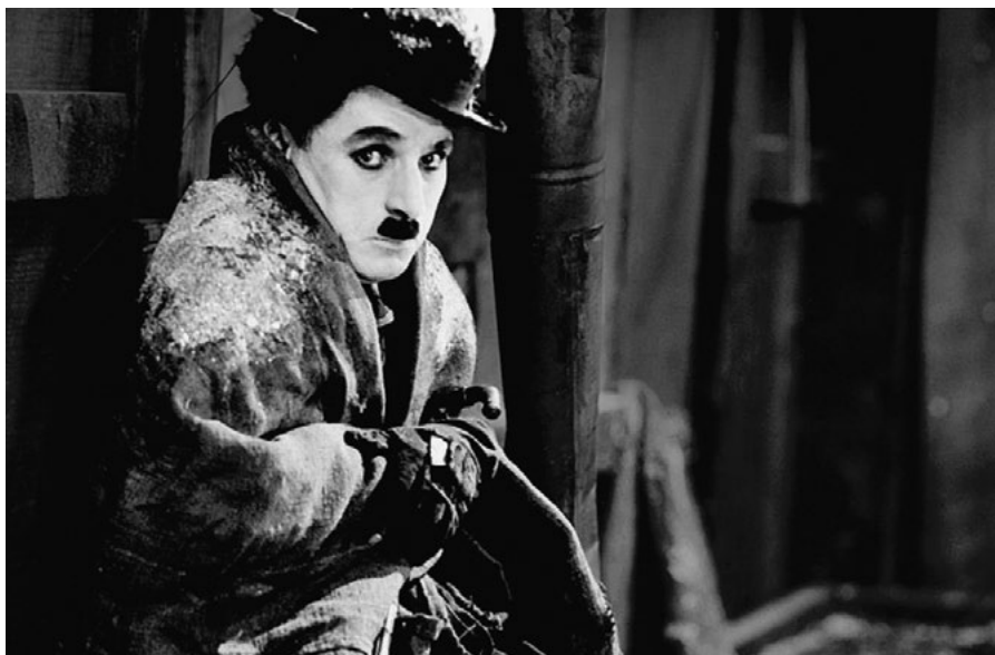
• LA RUÉE VERS L'OR