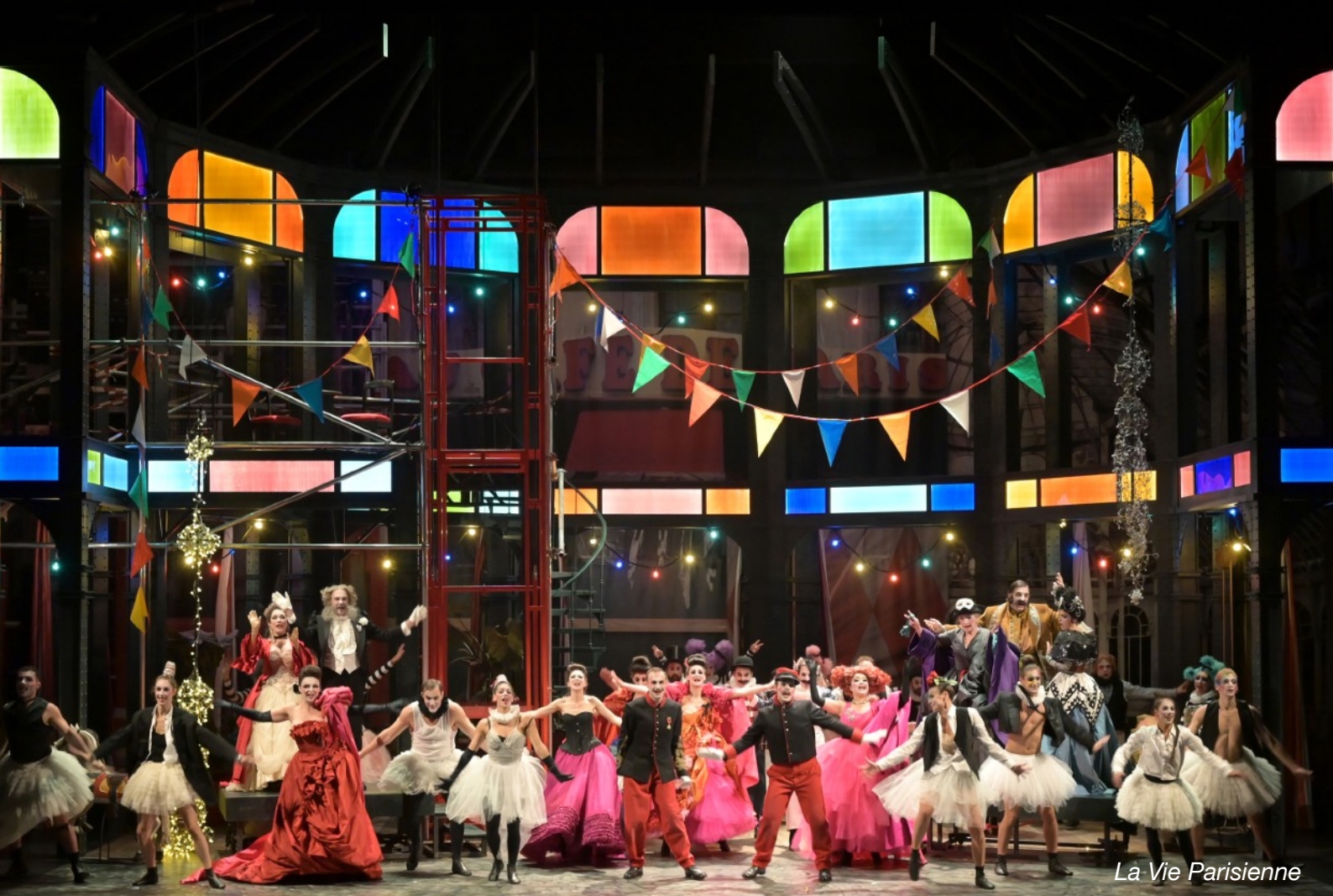
La Vie Parisienne